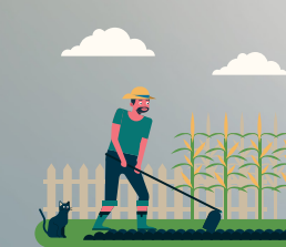
농자재 운반, 적재