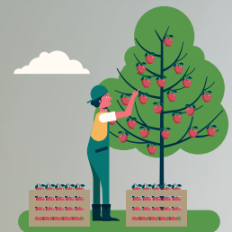
농작물 작업, 수확