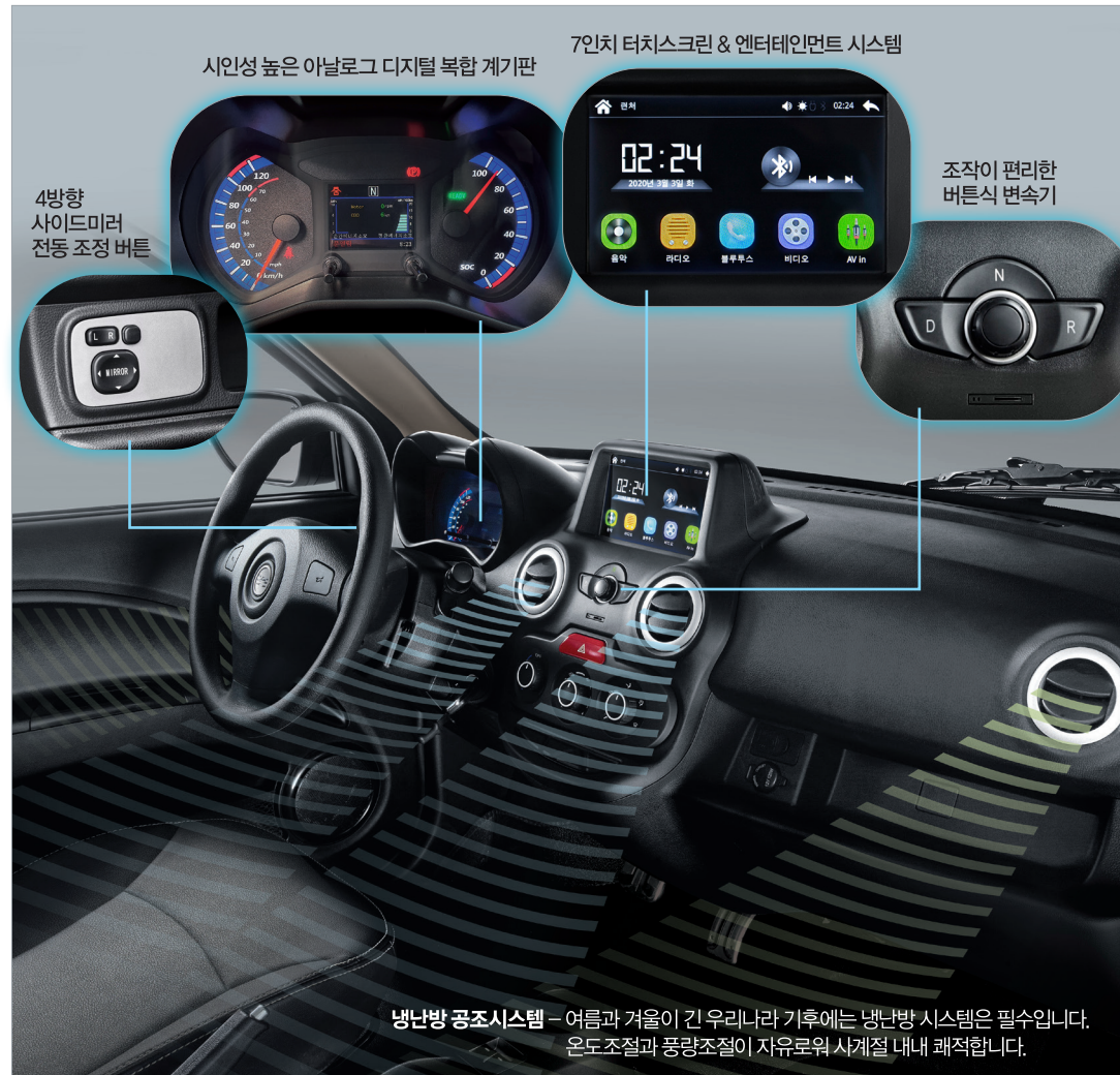
시인성 높은 아날로그 디지털 복합 계기판

사계절 내내 쾌적함을 유지하는 승용차급의 냉난방 공조시스템과 안전하고 즐거운 주행을 위한 각종 첨단 디지털 테크놀로지를 탑재한 D2P로 달리는 모든 길에 만족을 느껴보세요.