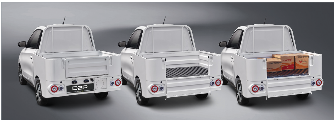
100kg 적재 가능한 대용량 화물 픽업 공간

1회 충전으로 101km까지 달리는 독보적 주행 거리와 100kg 대용량 적재 능력으로 농업 운반은 물론 공원이나 학교 시설 관리 차량으로도 제격입니다.