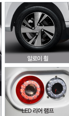
LED 리어 램프