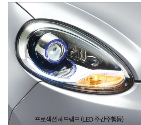
프로젝션 헤드램프 (LED 주간주행등)