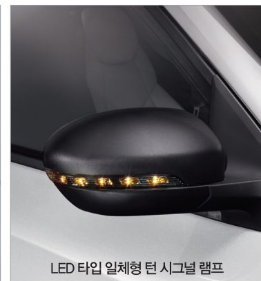
LED 타일 일체형 턴 시그널 램프