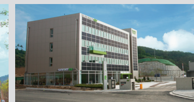
세종센터 : 세종특별자치시 전의면 미래산단4로 8

에디슨이브이 고객 여러분의 지속적인 관심과 성원 속에 전기차 분야에서 최고의 기술력과 품질을 가지고 생산하고 있습니다. 전기차의 축적된 기술력과 노하우로 소비자 인지도가 높아지고 있으며, 전기차 부분에 꾸준한 성장을 이어가고 있어 이젠 명실상부한 전기차의 대표주자로 자리매김하고 있습니다.