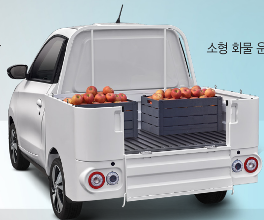
소형 화물 운반 배달